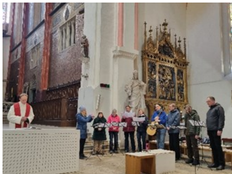
Zpívané ranní chvály na Velký pátek a Bílou sobotu

Významným dnem pro nás křesťany je Velký pátek. Je to postní den. Připomínáme si utrpení, ukřižování a den smrti Ježíše Krista. V tento den se konal proces Ježíšova odsouzení, poprava i pohřeb.