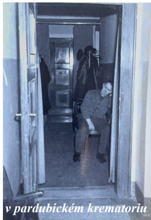
v pardubickém krematoriu

Velebnost a úcta štedro-večerní noci se naprosto umocnila, když pan vikář vystoupil na kazatelnu, aby k nám všem přítomným promluvil. Jeho oslovení „Drazí přátelé, vítám vás všechny v této svaté noci, kdy celý svět prožívá pravou podstatu vánočních svátků...“, zaznělo tak hluboce a přesvědčivě, že od tohoto okamžiku bylo v kostele naprosté ticho. Po těchto slovech začala mše svatá. Po ukončení sváteční bohoslužby se celý kostel rozezněl koledou „Narodil se Kristus Pán“, a pak se lidé s úsměvem na tváři a ohromení tajemstvím této noci rozešli do svých domovů.