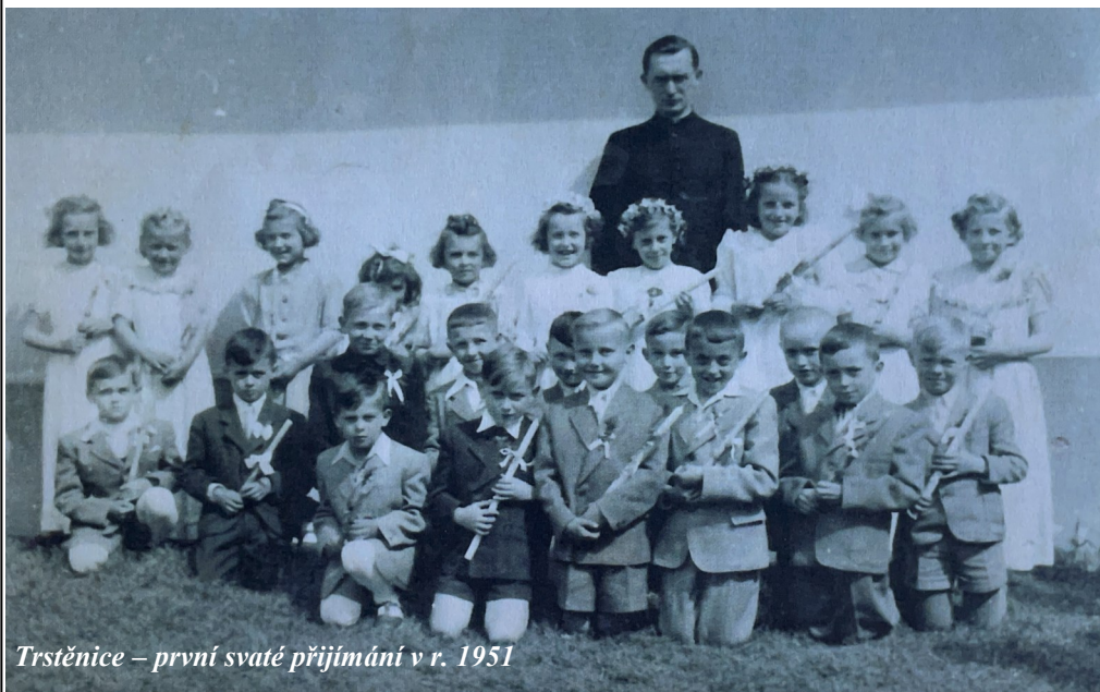
Trstěnice – první svaté přijímání v r. 1951