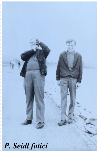
P. Seidl fotí

Ve škole na náboženství se zkouší jako u „češtiny“. Pan farář si ověřuje, jestli jsme správně všechno pochopili, a koncem druhé hodiny je chvílka na dotazy a odpovědi. Tuto část máme nejraději. Pamatuji si, že jednou došlo i na Fučíkovu Reportáž. Založil kroužek šachistů. Všichni jsme se učili hrát šachy a na faře jsme pořádali soutěže. A v neposlední řadě nás zasvěcoval do tajů fotografování. Sám měl dvouokou zrcadlovku. Jsme často na jeho fotografiích, ale nikdy nás nenapadlo vyfotit se s ním. O prázdninách pro nás organizo-