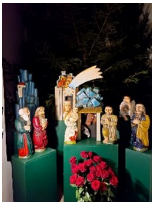
Obrázky ke vzpomínce na Vánoce v hlavním kostele