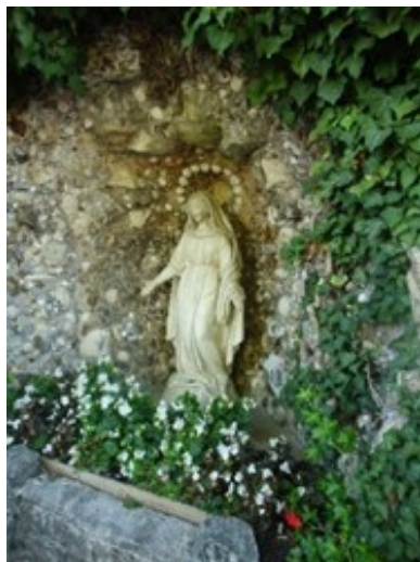
Francie 1858, Nevers, Panna Marie Lurdská

Uzávěrka příštího čísla farního občasníku je 31. 3. 2024. Své příspěvky můžete zasílat na adresu kajmar@chrudim.cz . Salvátor č. 74 vyjde 14. 4. 2024.